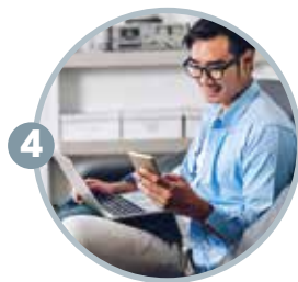
4 长期面对电子产品， 居家工作人士