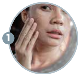
1 肌肤出状况的人 如、痘痘、黑斑、皱纹、下垂等