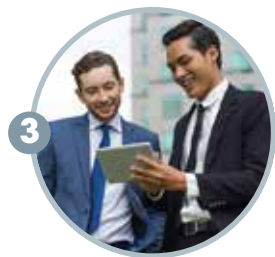
3 经常在外跑业绩的人士