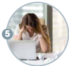
5 气色不佳、压力大的人士