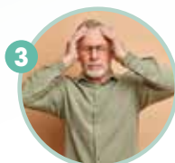
3 體弱多病的老年人