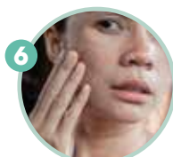
6 皮膚不好， 提早老化